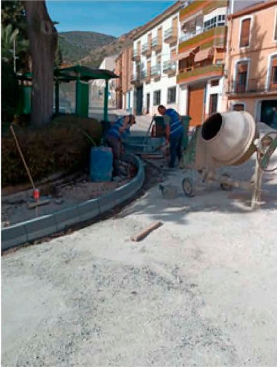
El pasado 23 de enero de 2024 se retomaron las obras en la calle Cristo de Burgos con la rea-

nudación del Programa de Fomento al Empleo Agrario (PFEA).