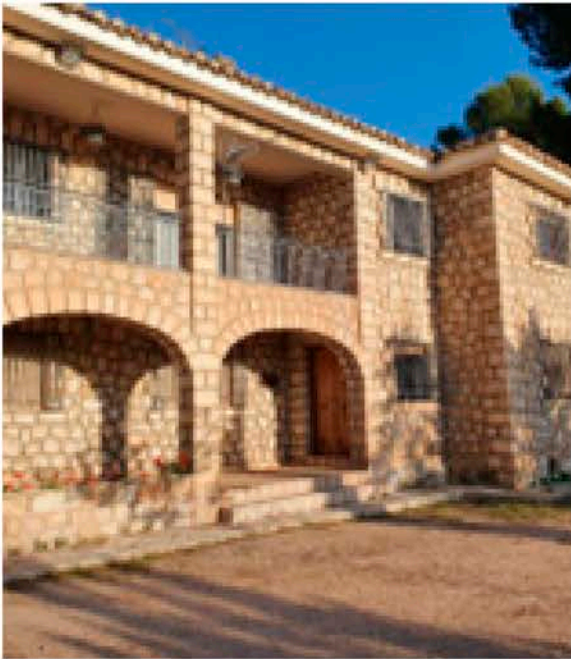
El día 29 de enero de 2024 dieron comienzo las obras en la Casa de la Pradera, consistiendo en mejoras de las condiciones de habitabilidad, instalaciones y eficien-

nudación del Programa de Fomento al Empleo Agrario (PFEA).