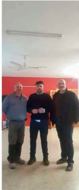
las obras en el Hogar del Pensionista, que comprenden la ampliación de estancias mediante la eliminación de tabiques y la renovación de la cocina y los suelos.

cia energética para su puesta en marcha como albergue, dotando a la localidad de mayor capacidad de hospedaje. Al mismo tiempo, se han iniciado también