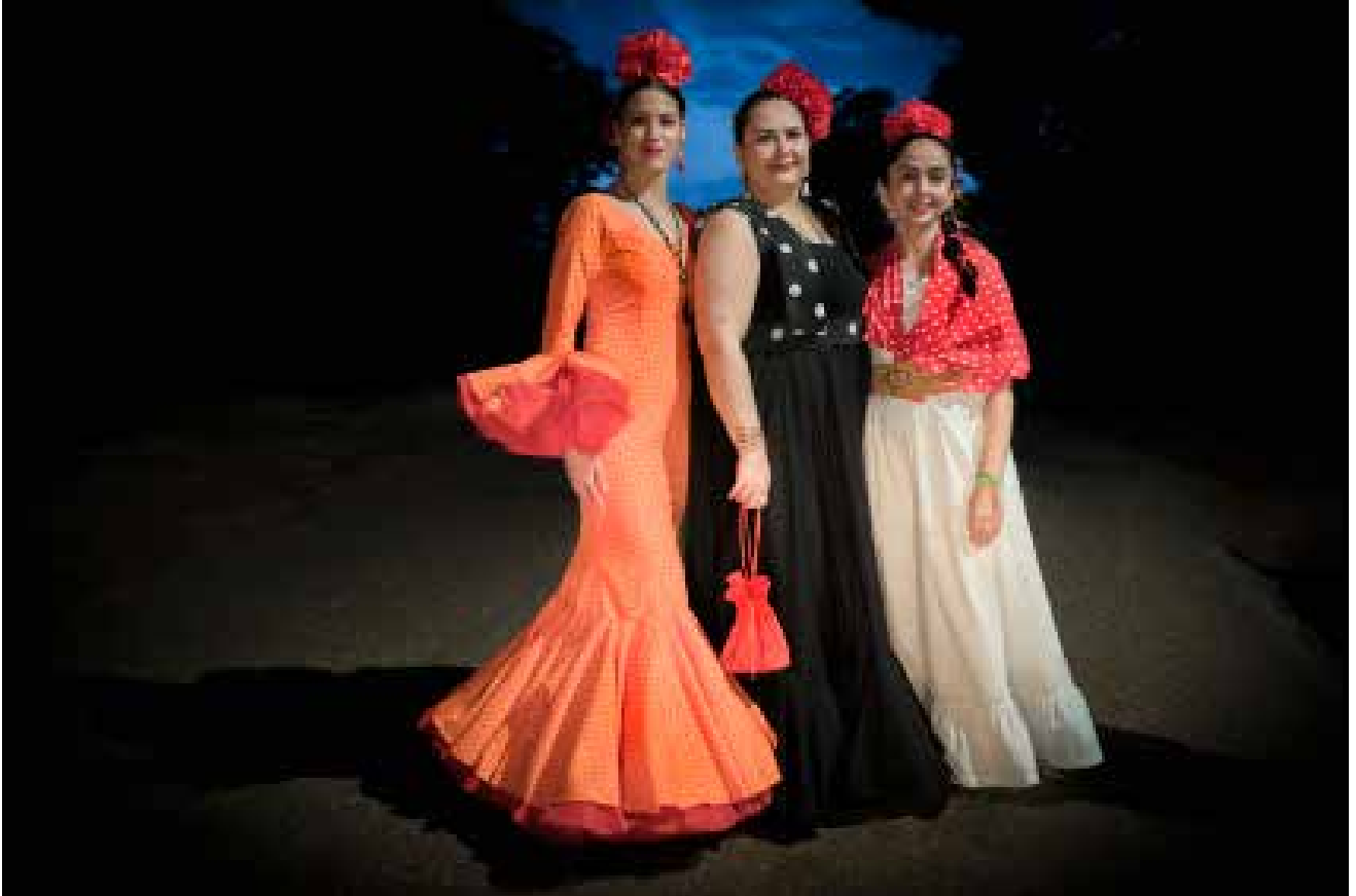
Amigas al termino de la romería