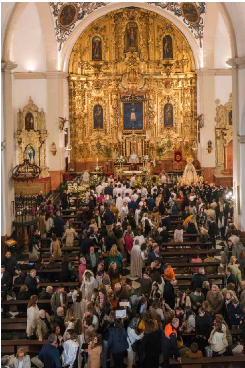
Domingo de Resurrección