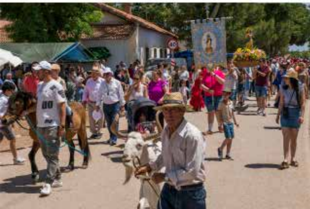
Romería de la Inmaculada Concepción