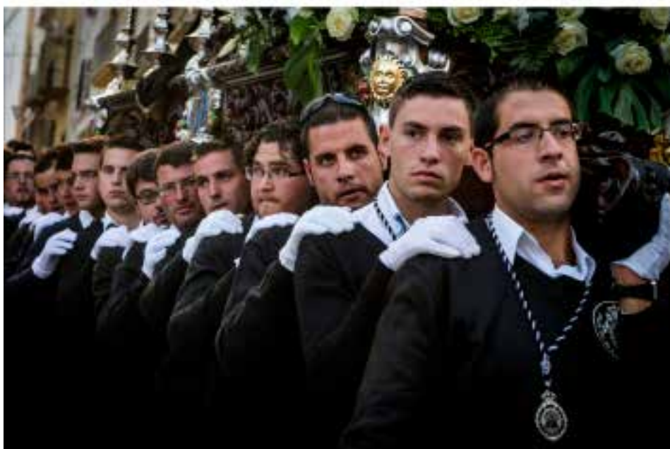
Costaleras y costaleros