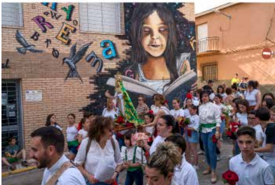
Escolares celebran el Mes de María