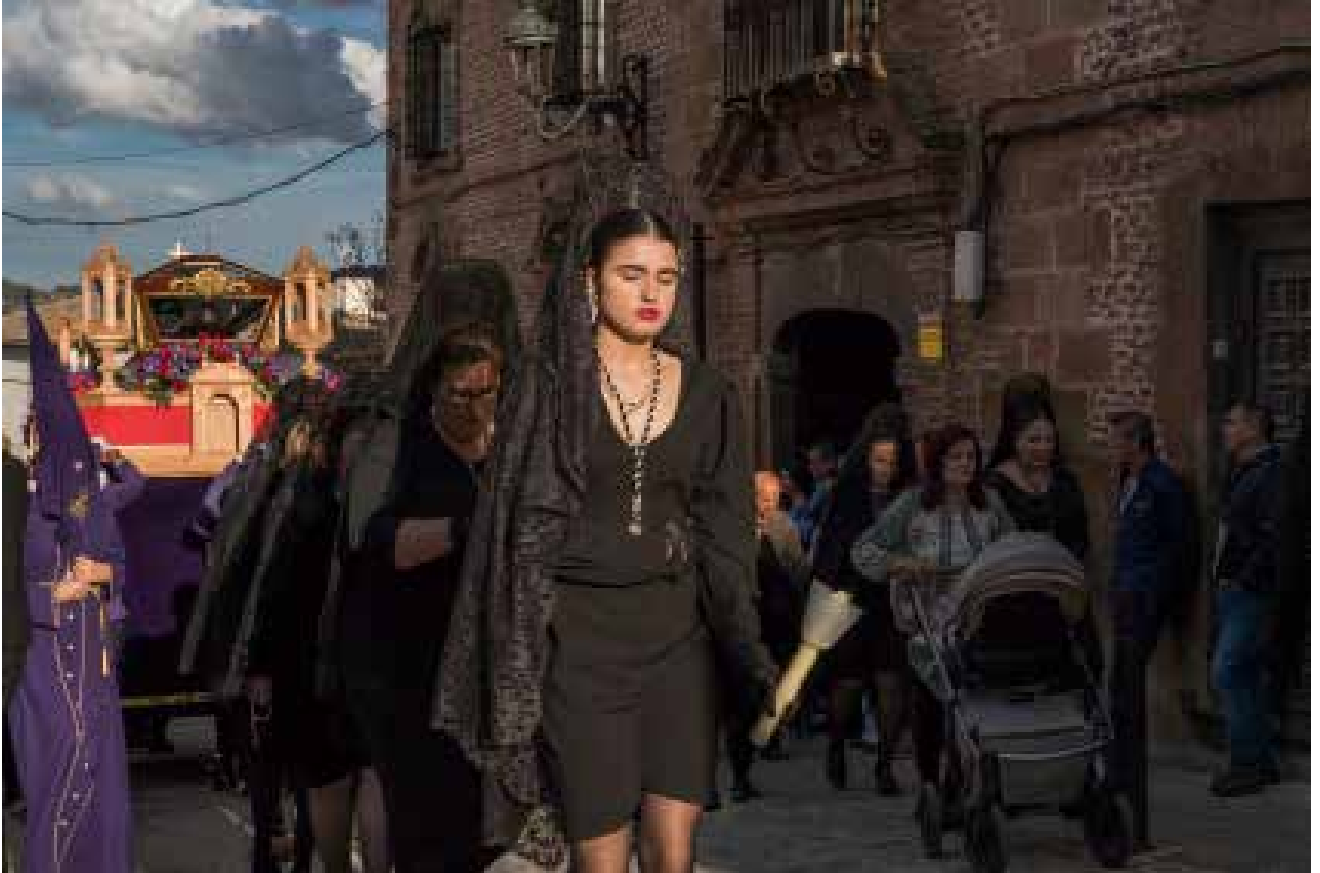
Procesión del Santo Entierro