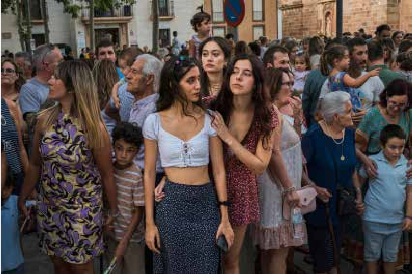
La Plaza en verano (aguardando al Pinchaúvas)