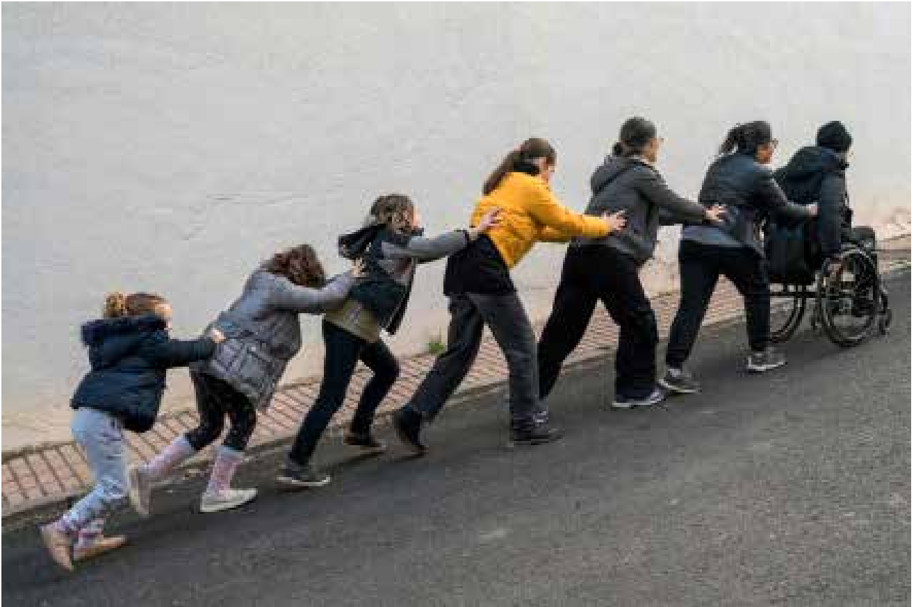
Paseo en familia