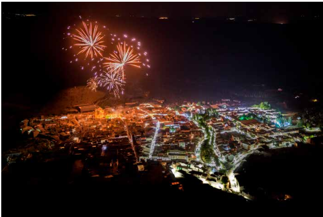
Clausura de Fiestas