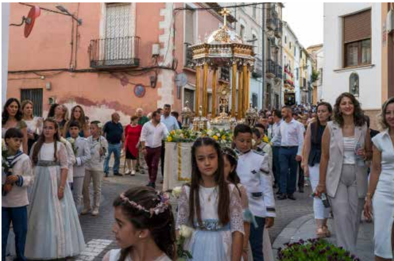
Procesión del Corpus Christi