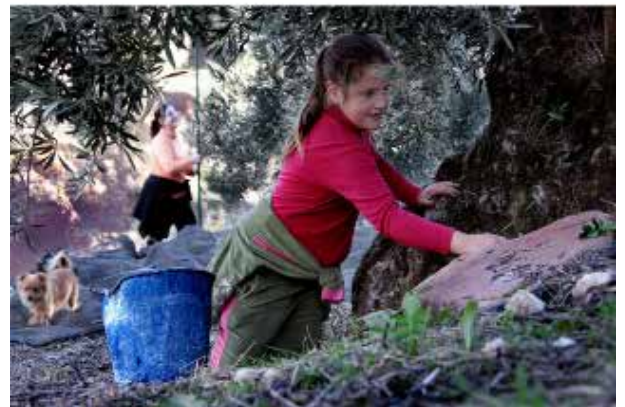
Temporada de aceituna