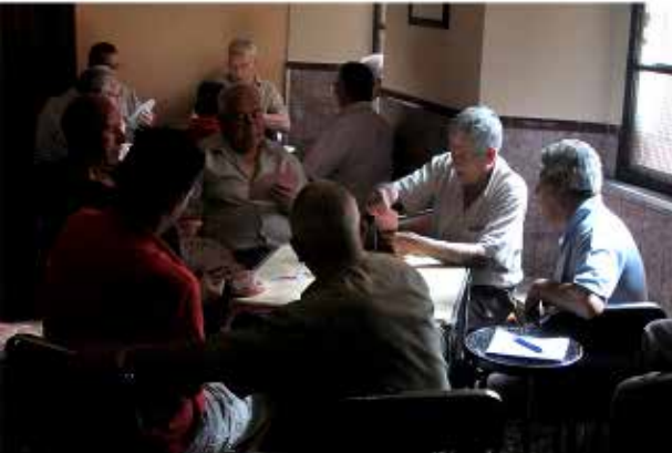
Bares (Chules, Chispas y Alcayata)