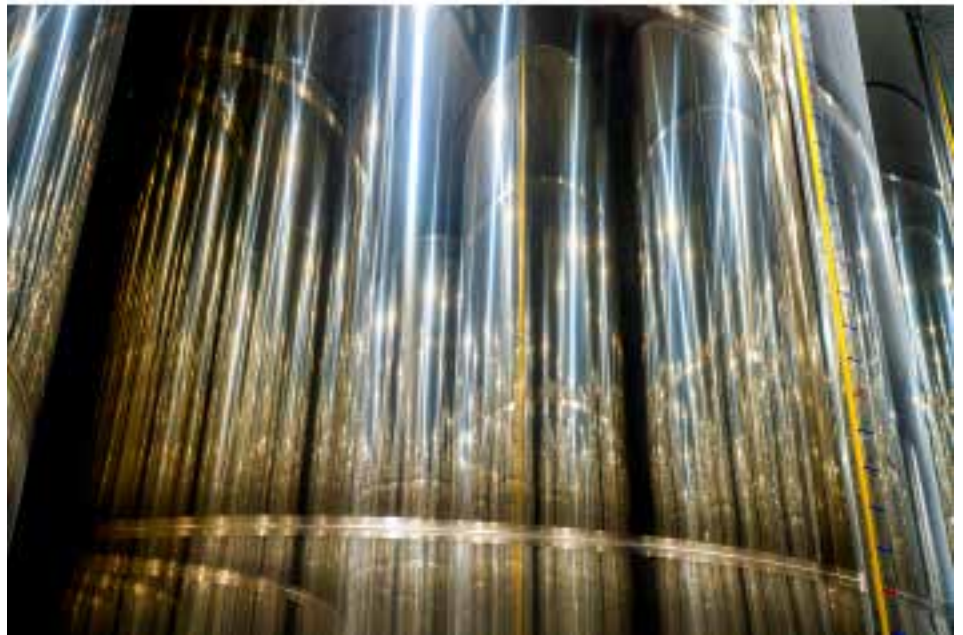
Temporada de aceituna