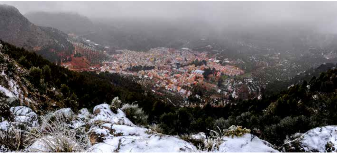
Cabra en invierno