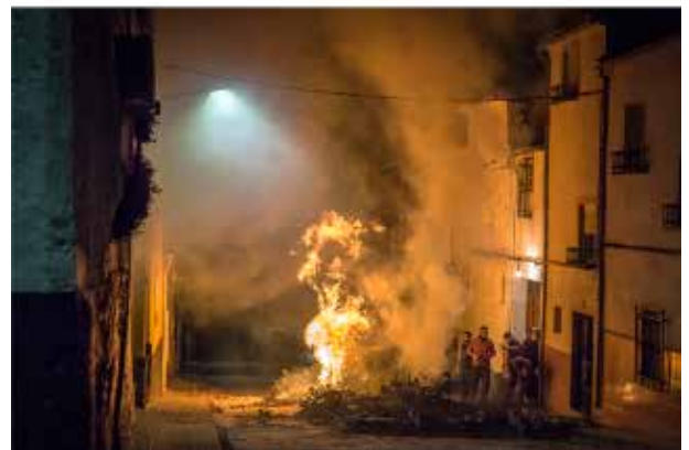
Hogueras de San Antón