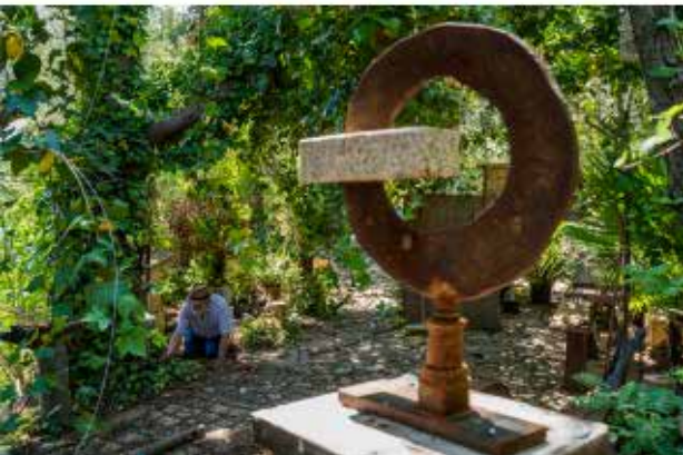
El jardín de Rafael