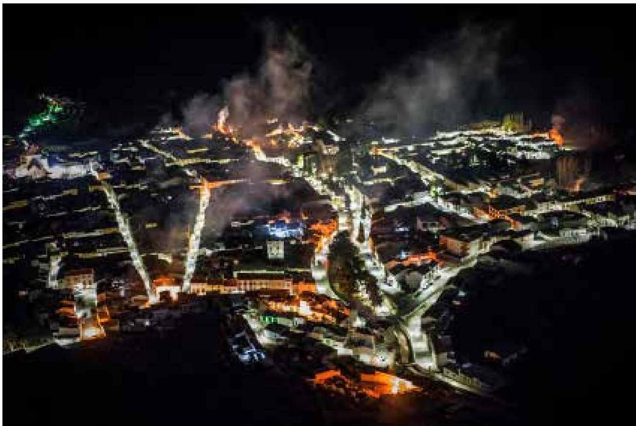
Noche de San Antón