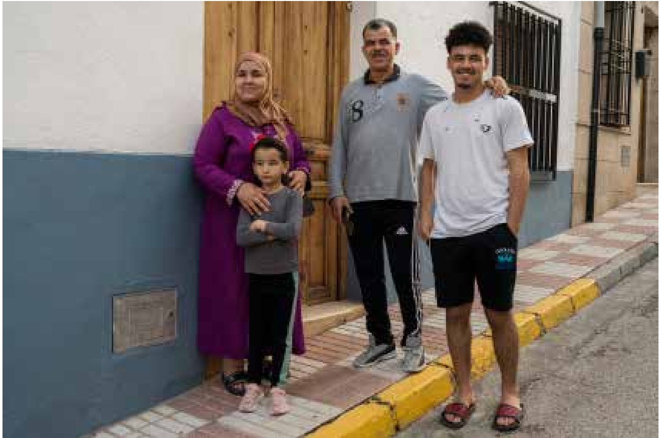
Vecinos en la calle Real