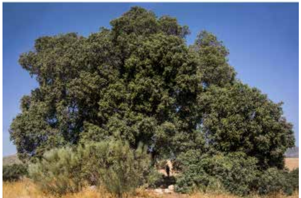
Artesanía metálica y encina milenaria