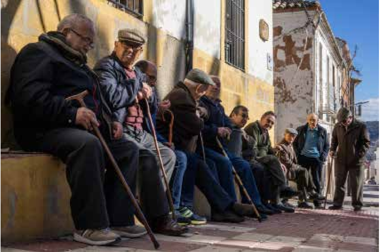
Mañana de invierno ("el Parlamento")