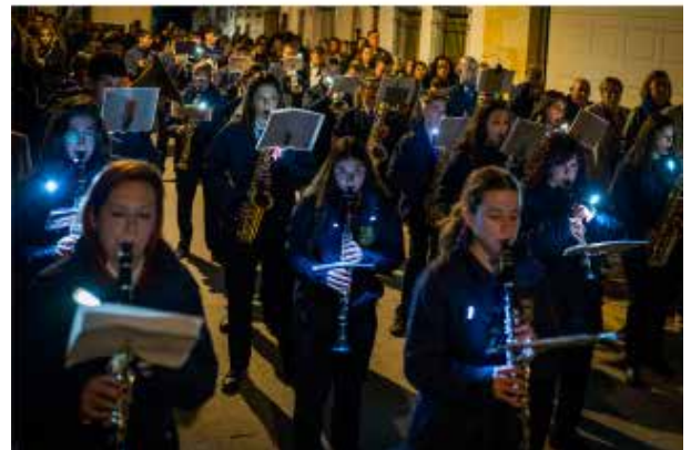
Procesión de la Soledad