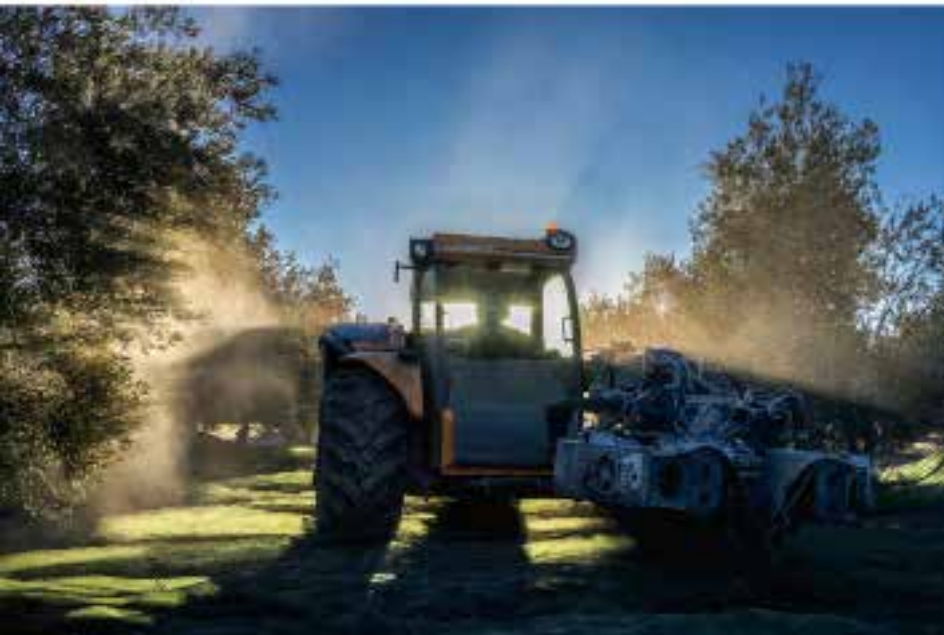
Temporada de aceituna